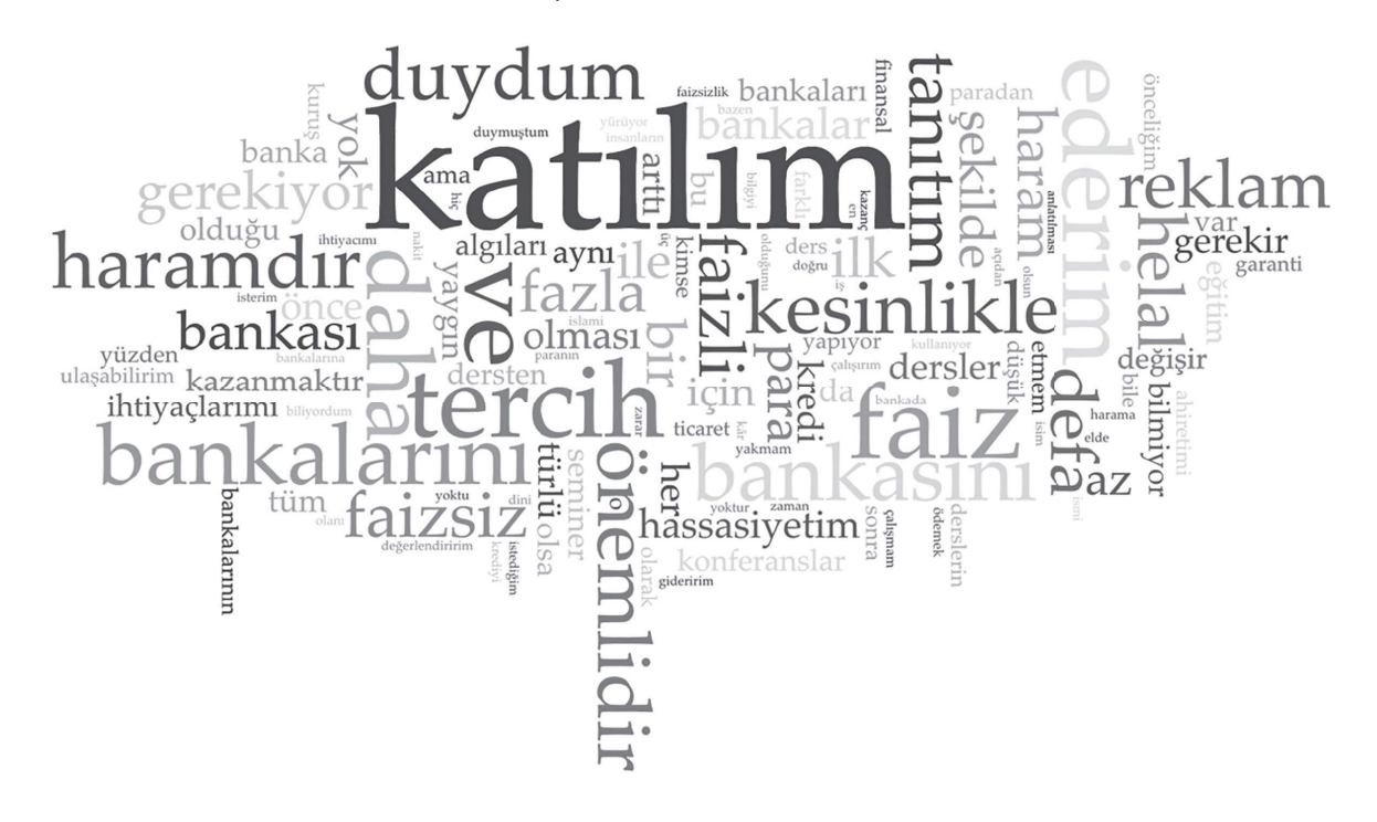
Şekil 1: Kelime Bulutu

Katılımcıların ifadeleri kapsamında elde edilen veriler ışığında kelime bulutu oluşturulmaktadır. Kelime bulutu işlevi, kelimelerin metin içindeki kullanım sıklığına göre boyut ve renk değiştirerek görselleştiren bir yöntemdir. Kelimelerin sıklığı arttıkça, yazı boyutları da artmakta ve renkleri daha koyu hale gelmektedir. Bu şekilde, metnin anahtar kelimeleri daha belirgin hale getirilmektedir. Şekil 2'de kelime bulutu yer almaktadır.